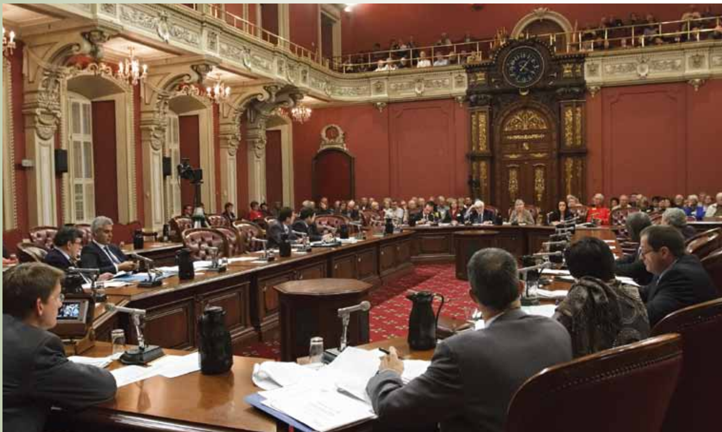
Commission parlementaire sur le projet de la loi 23 (octobre 2011).

Puisque, lors de la dernière négociation, le gouvernement a décrété les conditions de travail de ses employés, la négociation au chapitre du régime de retraite ne s'est pas poursuivie. C'est l'indexation qui était la priorité au chapitre du dossier retraite pour les centrales syndicales. La négociation des régimes de retraite en 2009 apporte donc une leur d'espoir.