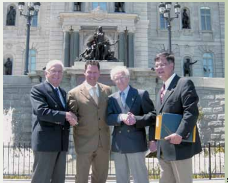
Dépôt par le GTAR d'une motion à l'Assemblée nationale soulignant le 25 e anniversaire de la désindexation des régimes de retraite.

Le GTAR poursuit ses interventions publiques et médiatiques. Il y a le dépôt d'une autre motion unanime à l'Assemblée nationale demandant la création d'un comité de travail chargé d'évaluer les coûts des divers scénarios d'indexation. Des actions seront nécessaires pour que chacun