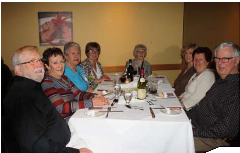
Souper du printemps