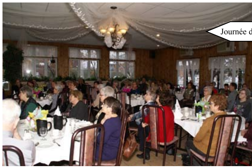
Journée des femmes