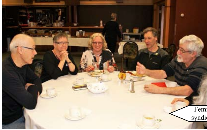
Femmes et syndicalisme