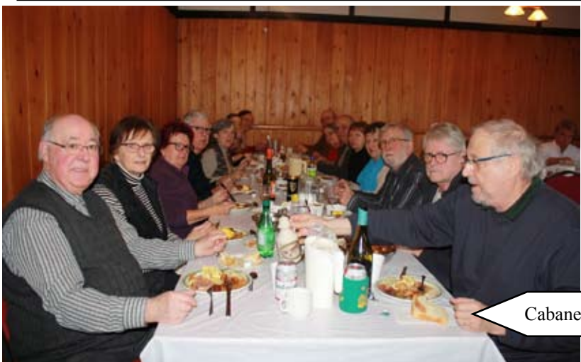
Cabane à sucre