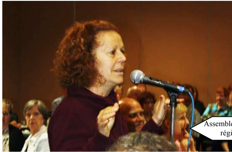
Assemblée générale régionale